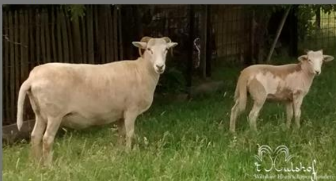
Met moeder Emmeline - 2015