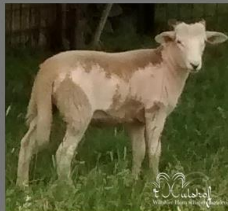
Juni 2015 2 ½ maand